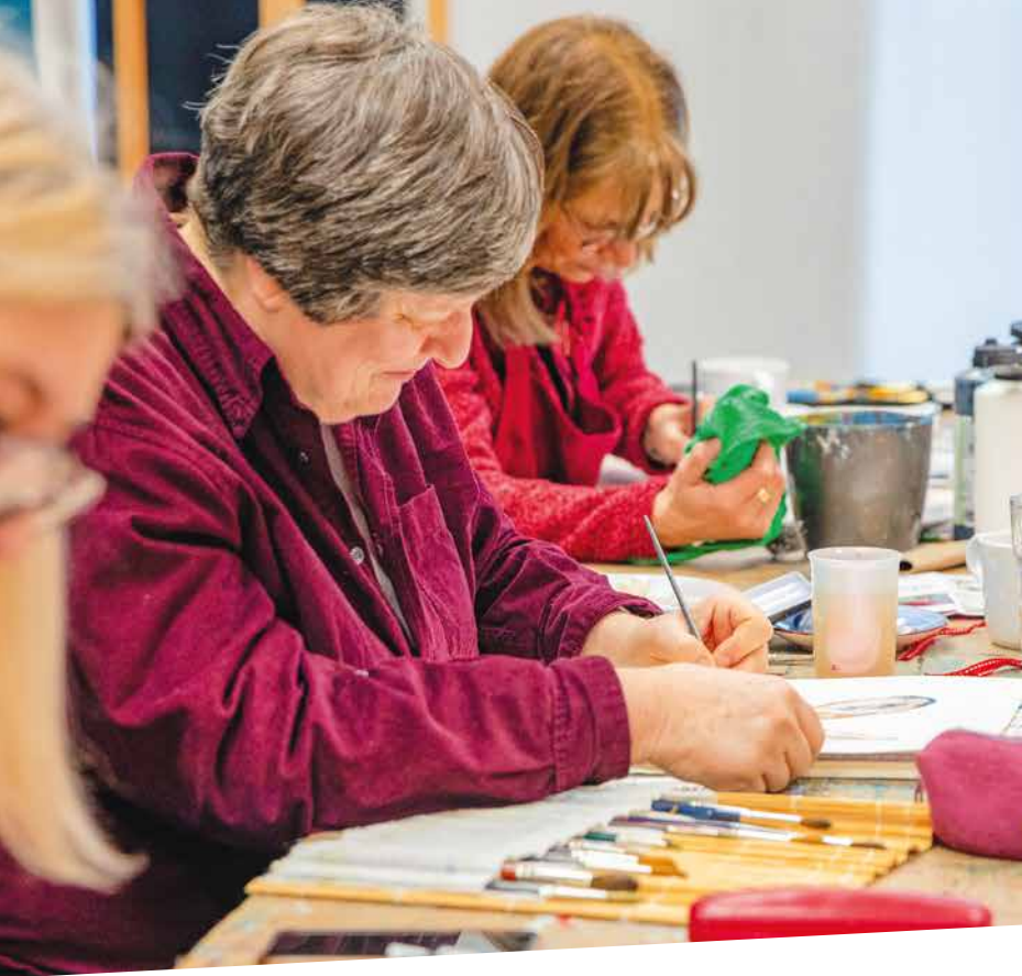
Pinsel, Farben und unterschiedliche Materialien stehen im Atelier Charisma für freies und experimentelles Arbeiten bereit.