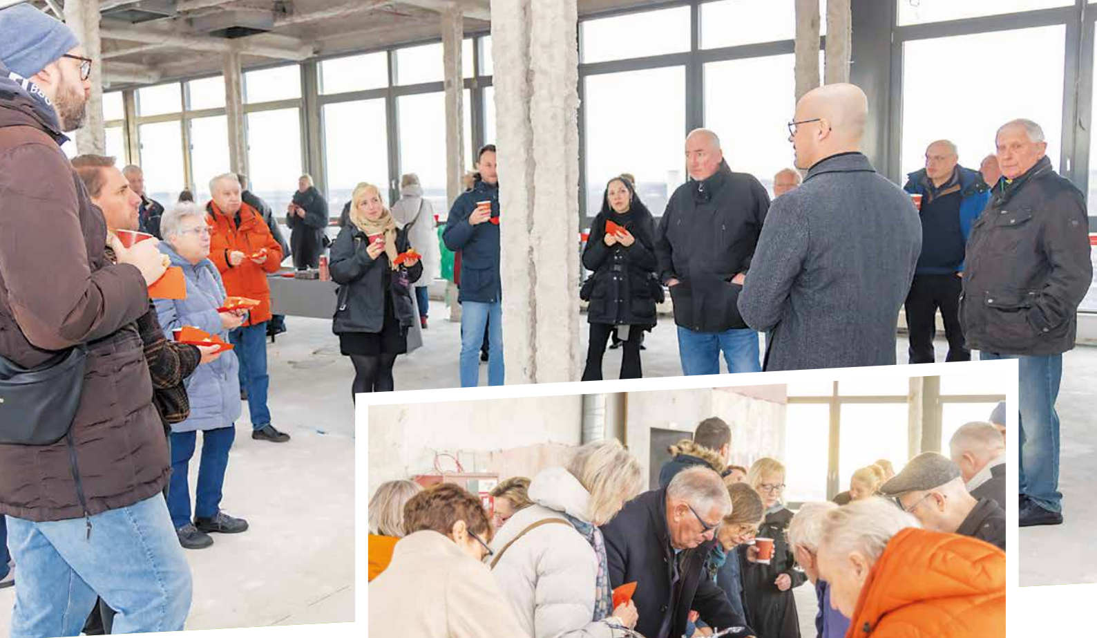
Beim gemeinsamen Austausch mit Kaffee und leckeren Zimtschnecken wurden aktuelle Entwicklungen im Quartier diskutiert.